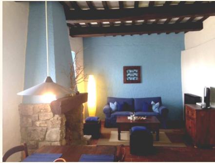
"Lavanda" il più grande ha una vista sui giardini e sulla valle verso sud e ovest.