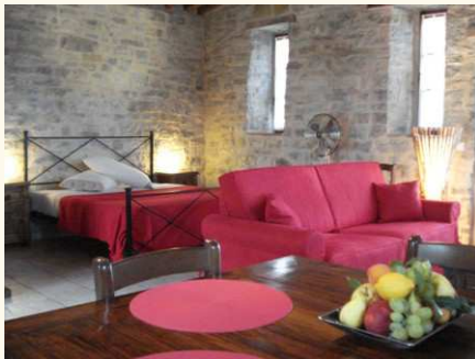
"Papavero" posto in un edificio indipendente con una vista sulla valle a sud e uno spettacolare scorcio sulla piscina.